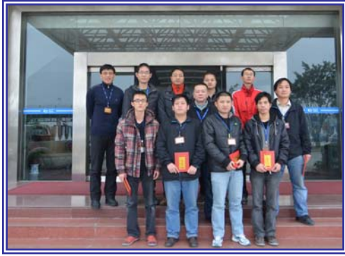
👉 2011年第四季度优秀 FICT 工作者及窗口服务明星