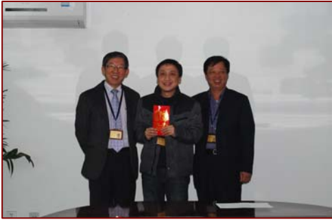
表彰 FQCT 操作部计划科 船舶计划组。 👈