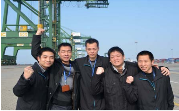
👉 FICT 明星员工